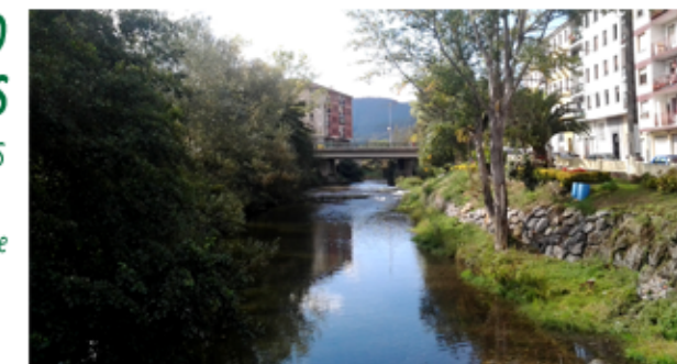
EL KADAGUA a su paso por Zalla

Ha transcurrido un año y medio y este Ayuntamiento no ha sido eficaz, no se ha trabajado bien por el municipio, ni por el bienestar de todas y todos sus ciudadanos.