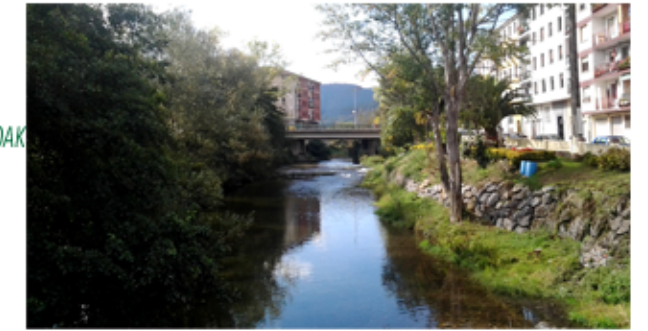
KADAGUA ZALLATIK IGAROTZEN DENEAN

Urte bete eta erdi igaro da, eta Udal hori ez da bat ere eraginkorra izan, ez da udalaren aldeko lan ona egin, ezta herritar guztien ongizatea bilatu ere.